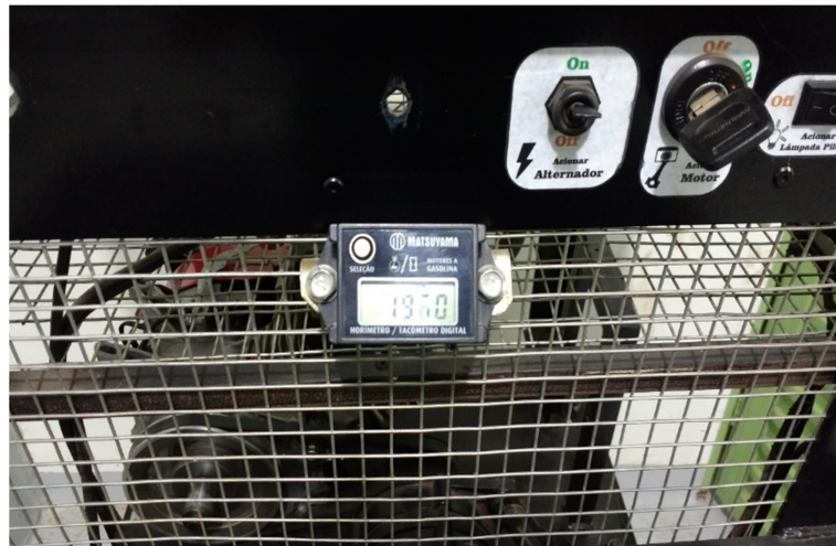
FIGURA 3 – Relógio horímetro instalado na bancada

Um relógio horímetro foi acrescentado à bancada para efetuar a contagem de horas que o motor trabalha. Esse quando desligado mostra as horas acumuladas até o momento e quando em funcionamento, junto ao motor, mostra as horas parciais trabalhadas. A Figura 3 mostra o relógio horímetro usado na bancada.