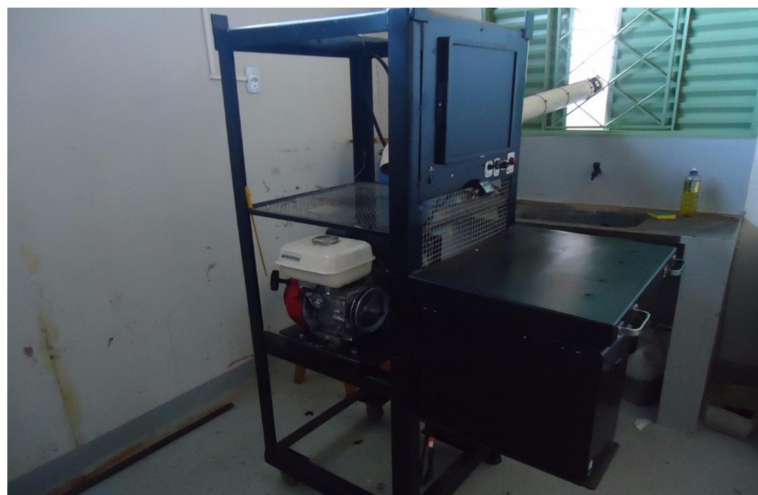
FIGURA 2 – Bancada com motor instalado

Foi colocado em uma bancada o motor utilizado para reproduzir uma carga de trabalho, vinculou-se o motor a um alternador por meio de uma transmissão por correia. A Figura 2 mostra a bancada com o motor montado.